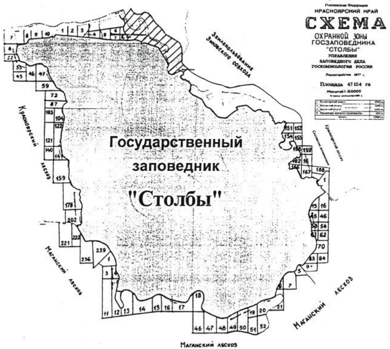
СХЕМА охранной зоны госзаповедника "Столбы" управления заповедного дела Госкомэкологии России