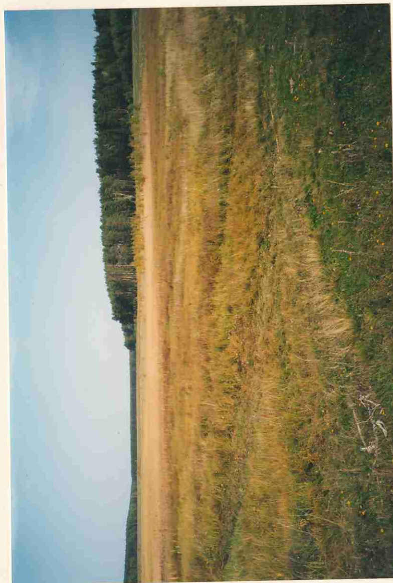
Место для фотографий, иллюстрирующих состояние государственного памятника природы в момент составления паспорта.