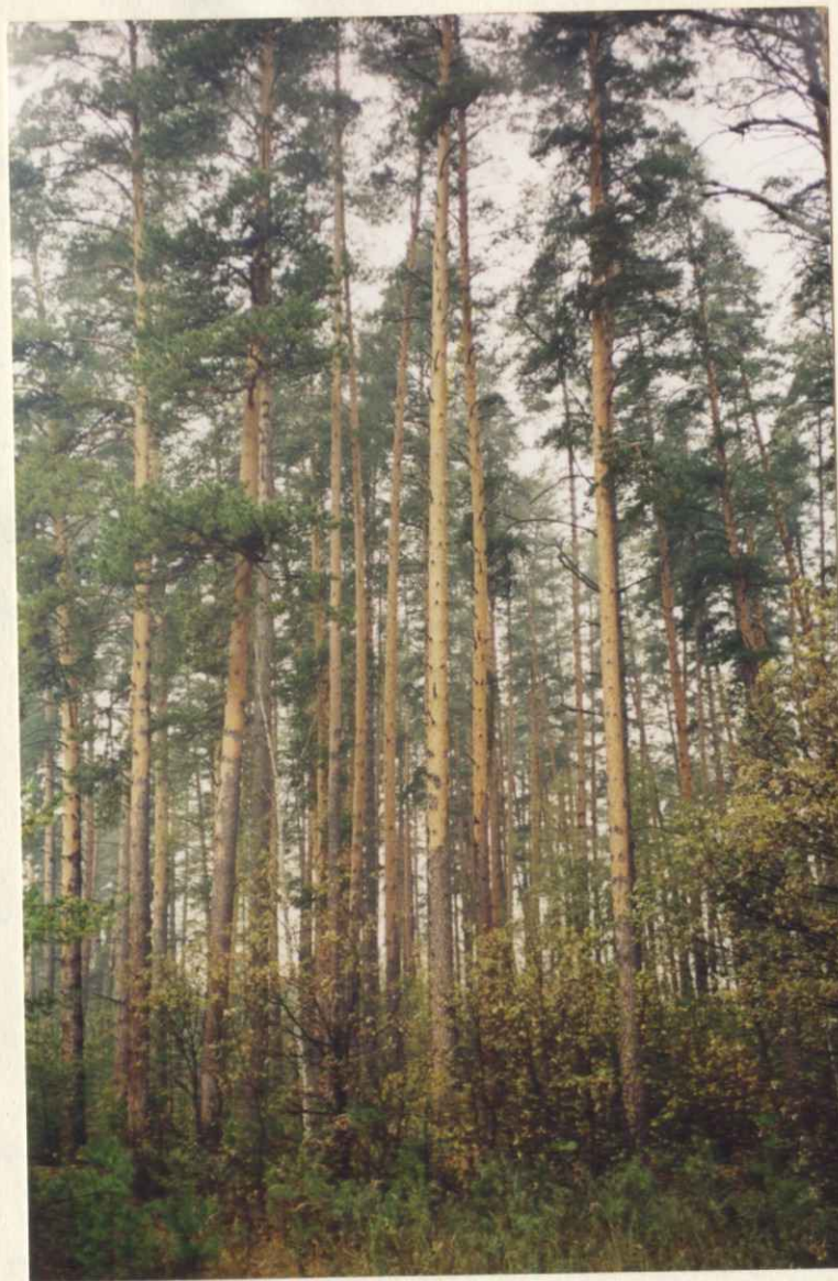
Место для фотографий, иллюстрирующих состояние государственного памятника природы в момент составления паспорта.

Закрываются все виды песочхозяйствен- ного пользования, кроме санитарных рудок и посадки леса на свободных площадях. Запрещен выпас скота, распашка, раскорчевка, прокладка дорог и все виды изыскатель- ских земляных работ