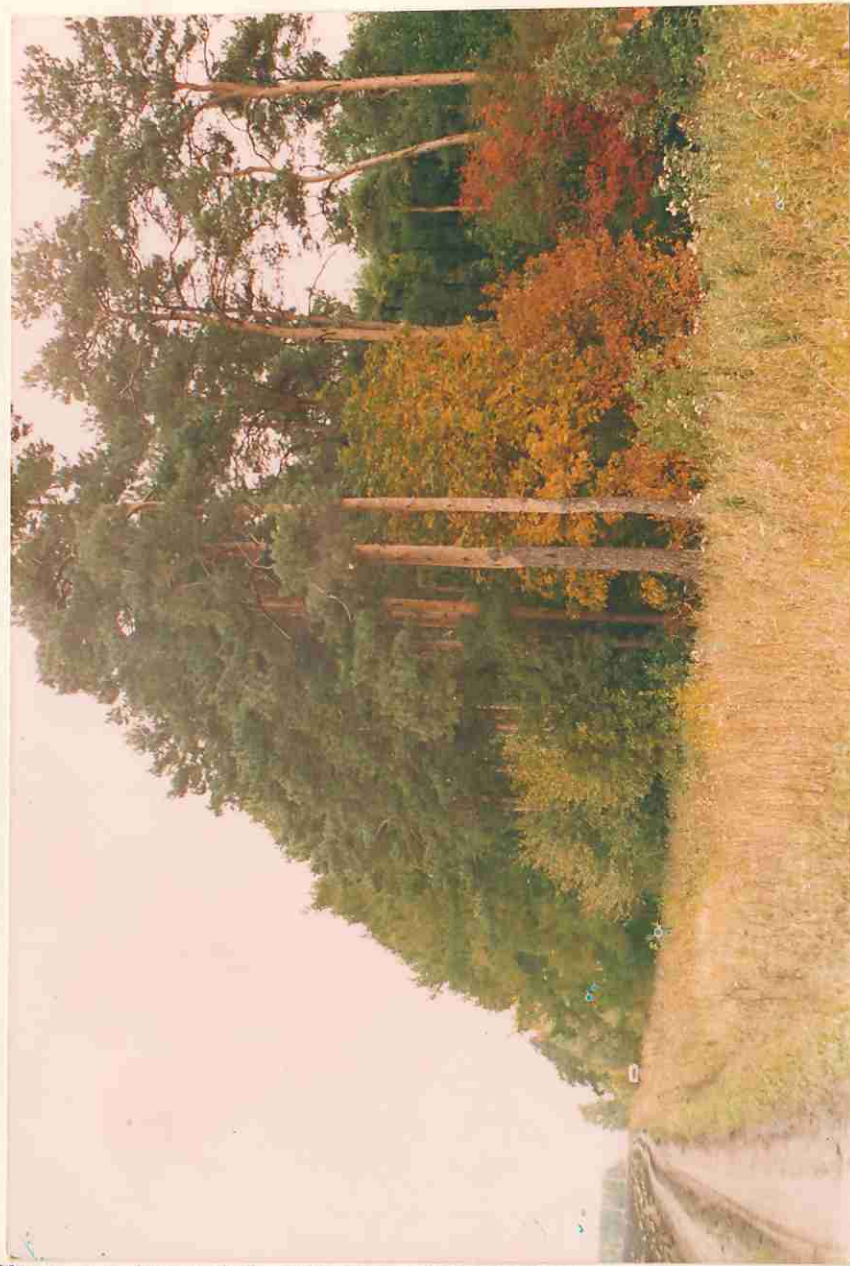
Место для фотографий, иллюстрирующих состояние государственного памятника природы в момент составления паспорта.

Мероприятия: создать внешнее огра- ждения, поставить аншлаги, закрыть въезды, провести рубки ухода, установить парковую медель, оборудовать стоянку для автомашин