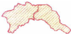
Граница территории государственного природного заповедника "Уссурийский" им. В.Л. Комарова

Приложение N 3 к Положению о государственном природном заповеднике "Уссурийский" им. В.Л. Комарова, утвержденному приказом Минприроды России от 1 июля 2021 г. N 459