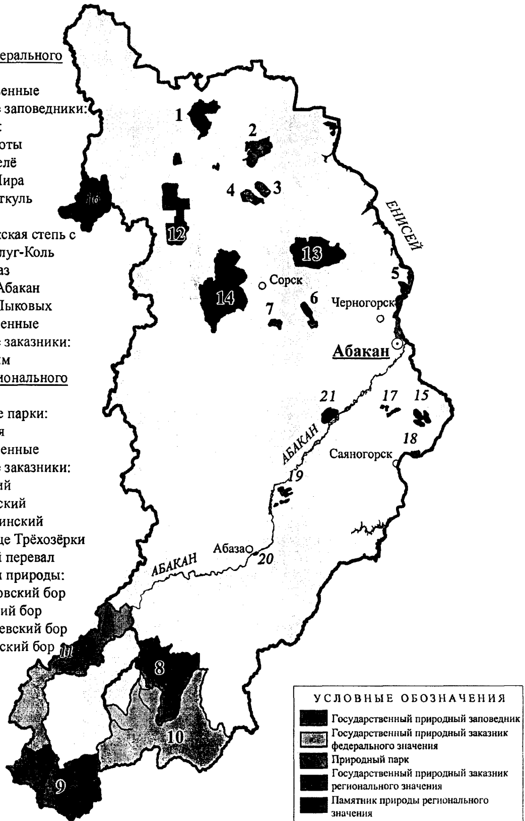
Рисунок 2. – Памятник природы «Абазинский бор» в системе особо охраняемых природных территорий Республики Хакасия

12. Июсский 13. Боградский 14. Кискачинский 15. Урочище Трёхозёрки 16. Олений перевал Памятники природы: 17. Смирновский бор 18. Очурский бор 19. Бондаревский бор 20. Абазинский бор 21. Уйтаг