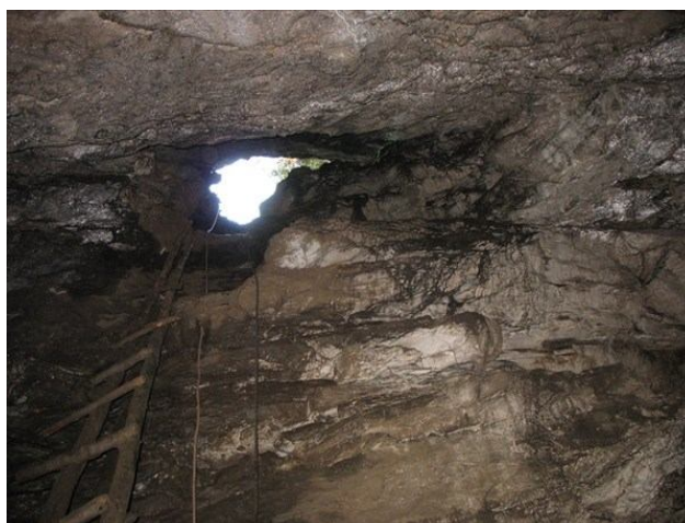
Рис. 1 Памятник природы республиканского значения "Пещера Тут-Куш" (сверху – вид входа снаружи, снизу – вид на вход изнутри пещеры)