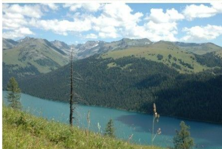
Рис. 1 Памятник природы республиканского значения “Озеро Тайменье”

Виды озера: северо-восточная сторона (вверху); южная сторона (в центре); западная сторона (внизу)