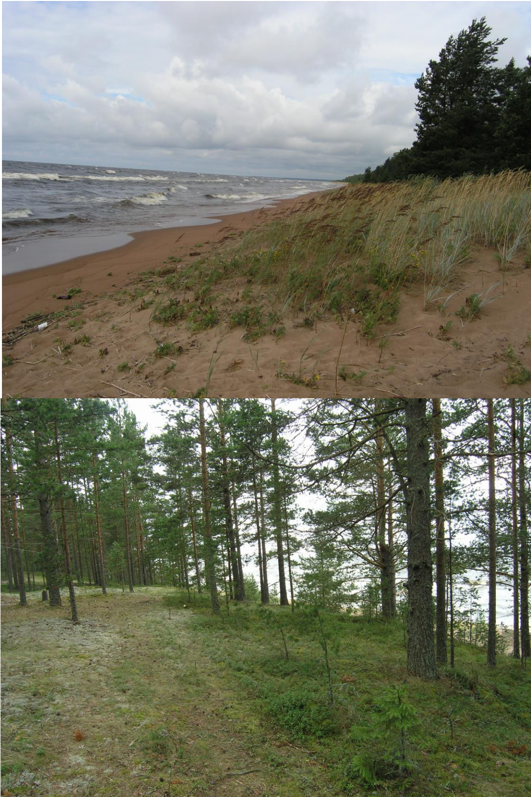
Рис.4-5 Фото объекта